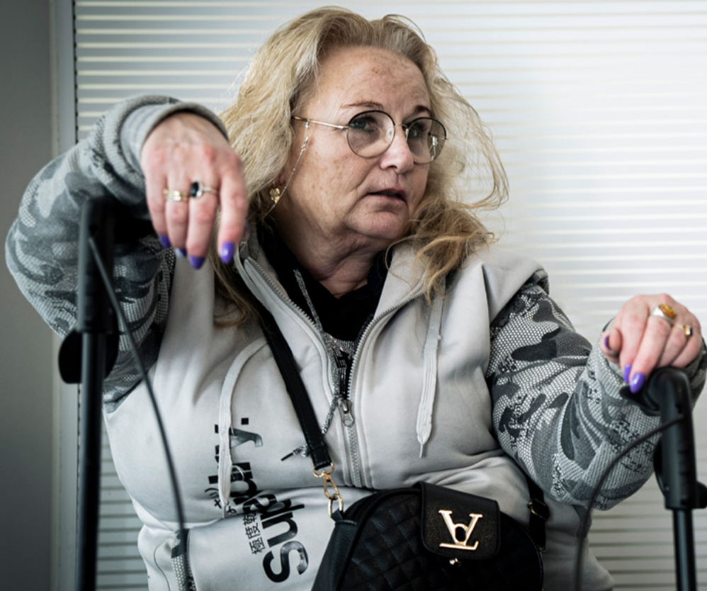
Sundheds- og Kvartershuset i Aalborg Øst er for borgere fra hele byen og bliver brugt af både unge, børnefamilier og ældre.