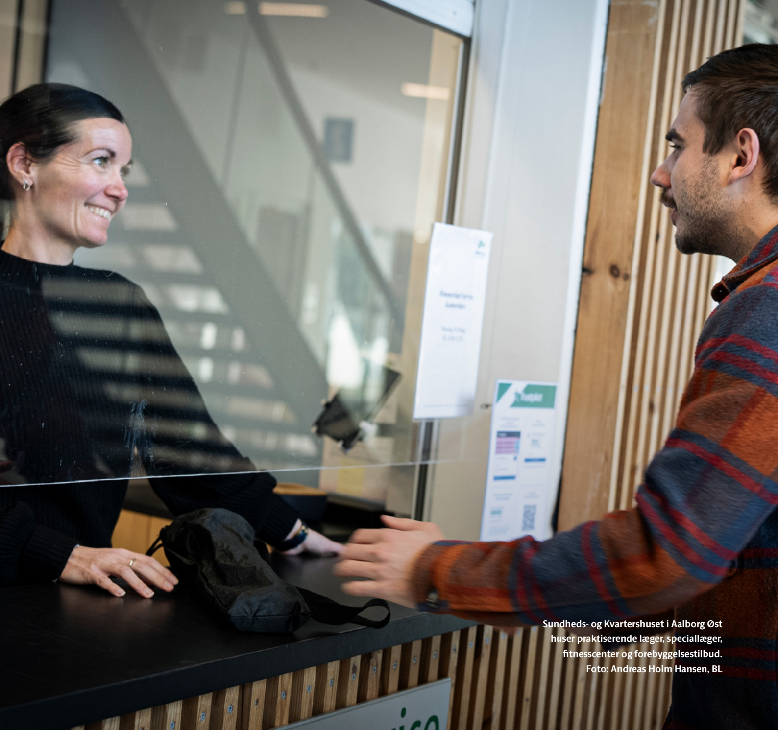
Sundheds- og Kvartershuset i Aalborg Øst huser praktiserende læger, speciallæger, fitnesscenter og forebyggelsestilbud.