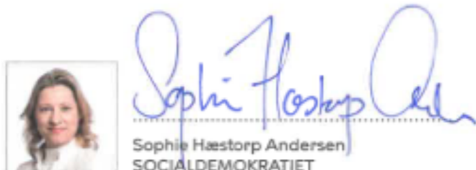
Sophie Hæstorp Andersen SOCIALDEMOKRATIET

Principaftale om budget 2024 og 2025 er indgået mellem følgende parter: