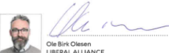
Ole Birk Olesen LIBERAL ALLIANCE